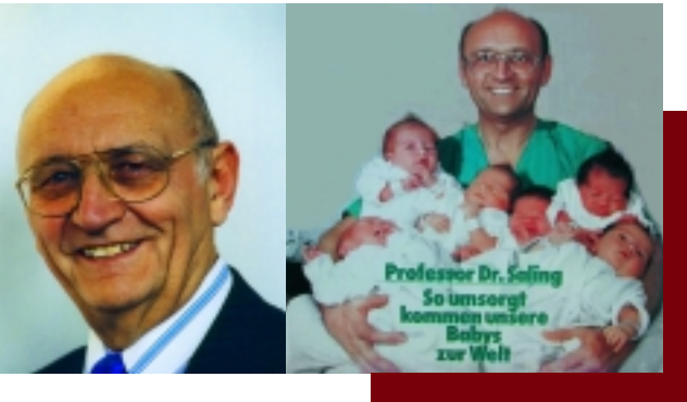
HÖRZU-Titelblatt vom 18. Nov. 1978